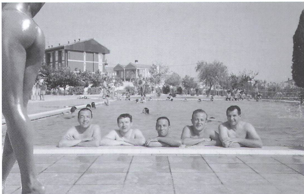
Reformada la piscina en el verano del 2001, su bordillo interior es una buena excusa para el alcabuteo del personal como se comprueba en la fotografía.